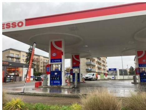
Le Chesnay – 05/12/2023