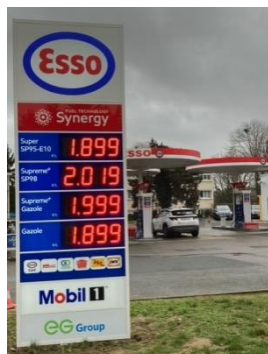
La Jonchère – 05/12/2023