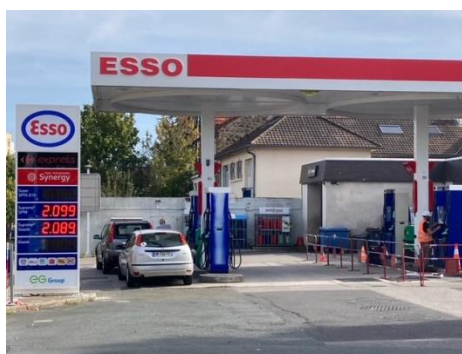
Versailles République – 11/10/2023

Ci-dessous, les photos des stations de Versailles République (Pegasus 21), La Jonchère (Eliot Noyes), Le Chesnay (Pégasus 21) et la station Lecourbe-Convention (Pegasus 21), successivement aux couleurs Mobil, BP et maintenant Esso.