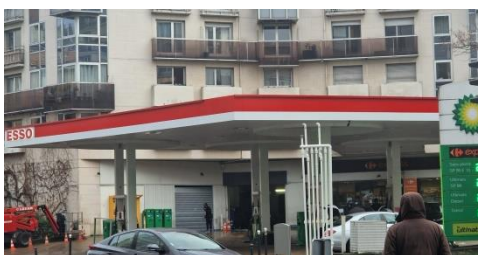
Paris Lecourbe – Convention : 1990 Mobil – 2000 BP – 11/02/2024 Esso